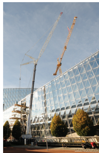
Le chantier du nouveau siège de «JTI» Japan Tobacco International à Genève (Sècheron).