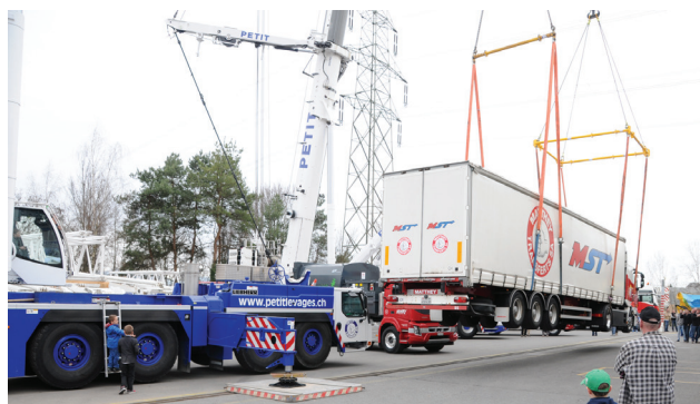
Un camion semi-remorque suspendu à deux grues: l'outil de communication de Petit Levages pour sa journée portes ouvertes en 2015.

Une expérience précieuse, car elle permet une évaluation plus juste des risques. Chez Petit Levages, nombreux sont les conducteurs de grues à avoir entre 20 et 30 ans de maison. Malgré des horaires et un rythme parfois éprouvant, ces derniers sont des passionnés. Il y a le plaisir de faire corps avec engins titanesques, maniés au centimètre près. Et celui d'avoir des journées aussi variées que ce qu'une grue peut porter.